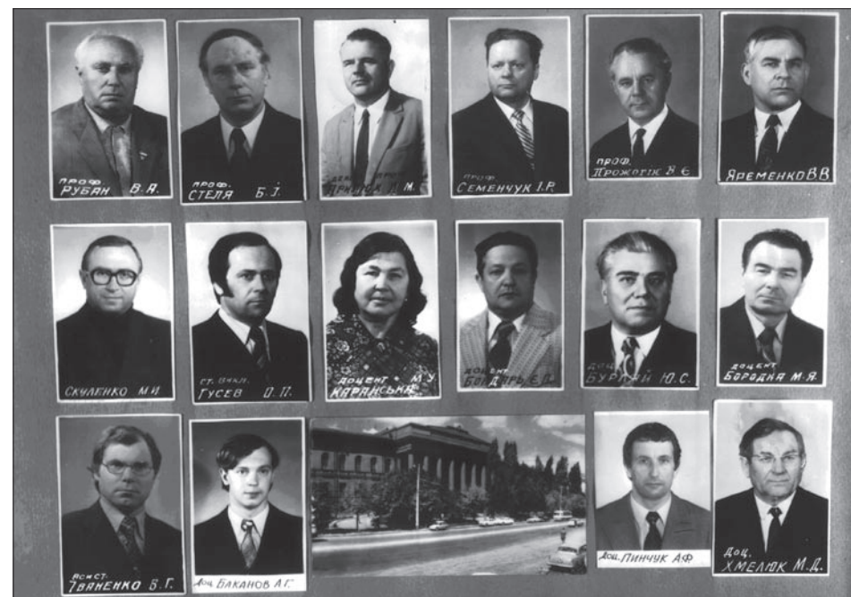
Викладачі факультету журналістики КДУ (фото з випускного альбому)