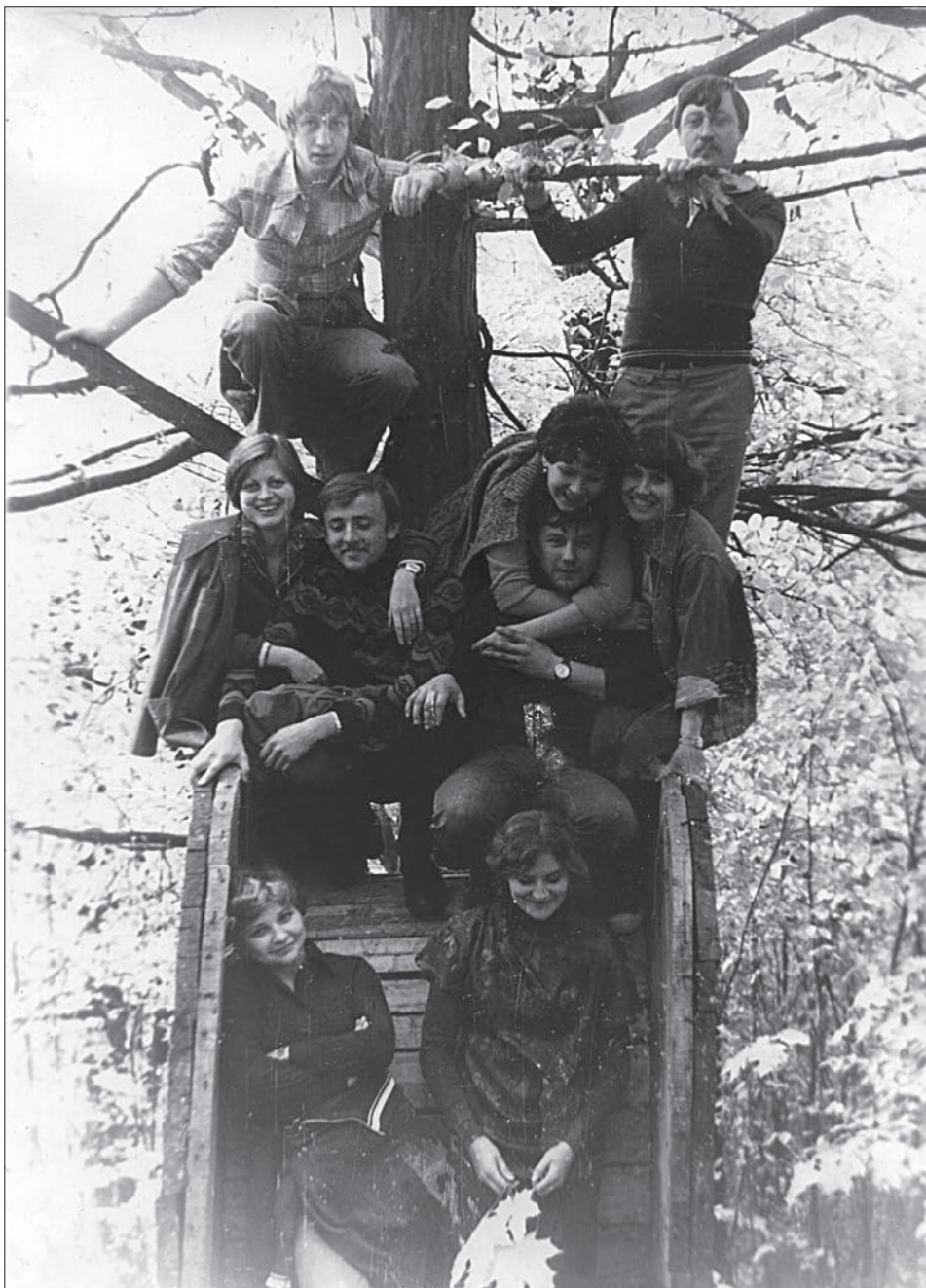
Коли були ще молодими...