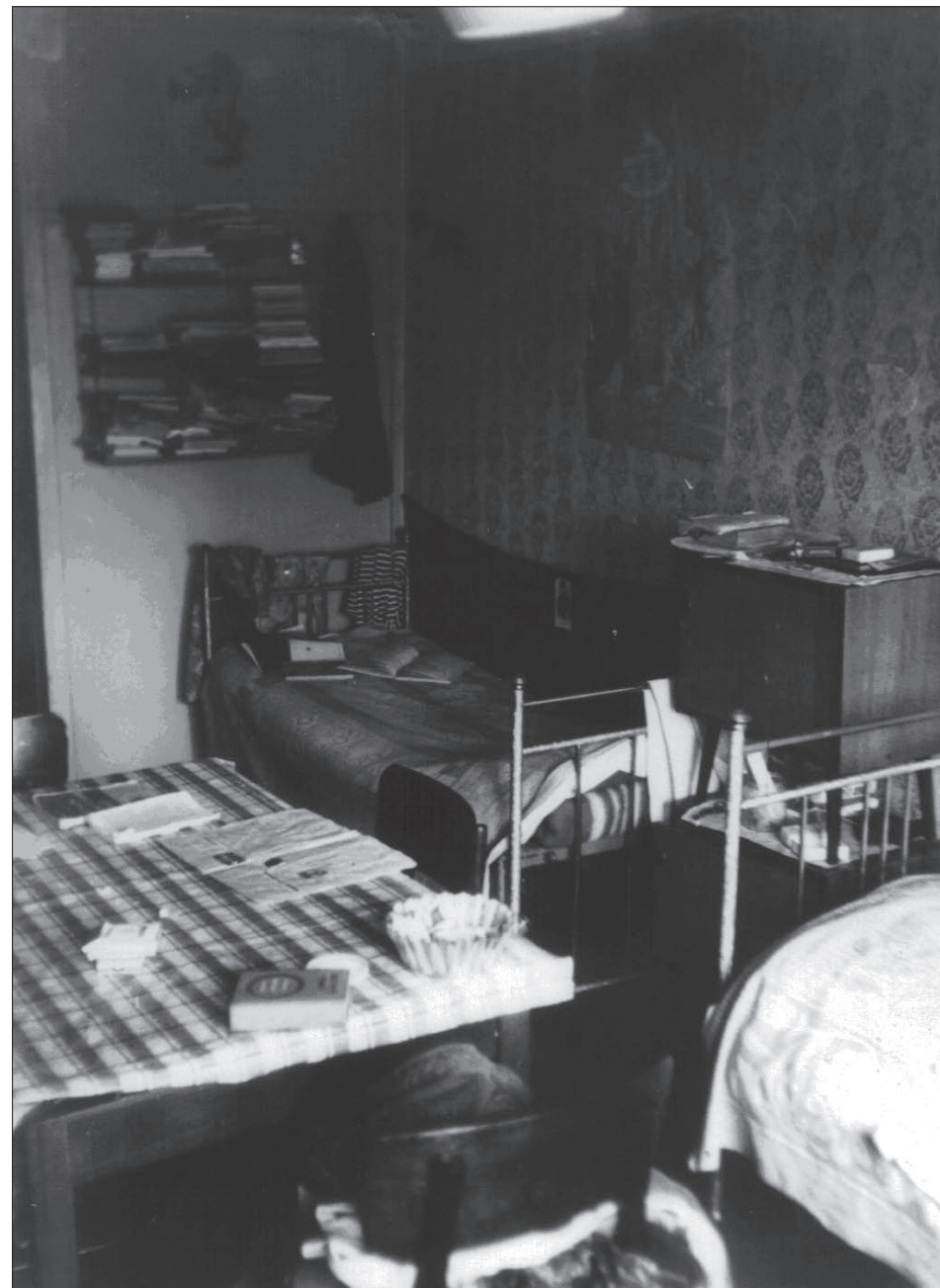
Інтер'єр кімнати в університетському гуртожитку № 3 студентського містечка на вул. Ломоносова